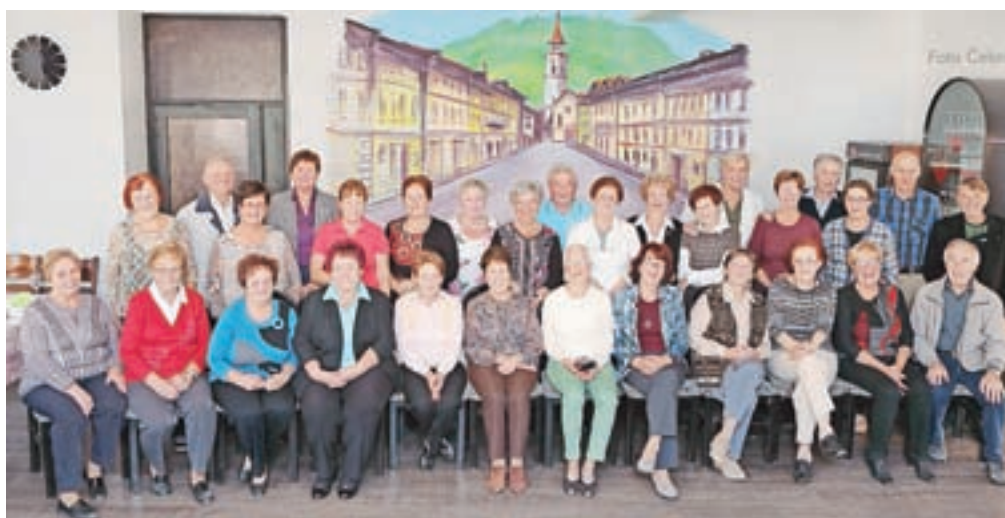
Fotografija za spomin

Tržič – Bil je petek, trinajstega oktobra, ko smo se v restavraciji Raj na srečanju zbrali sošolci in prijatelji letnika 1942. V prijetnem vzdušju in dobri postrežbi smo preživeli nekaj nadvse prijetnih uric ob spominih na mlada leta. Na koncu smo sklenili, da bo vnaprej srečanje vsako leto na prvi petek v oktobru ob 17. uri, zato že sedaj vabimo tudi tiste, ki se iz ga kakršnegakoli razloga tokrat niso mogli udeležiti, da se nam drugo leto pridružijo.