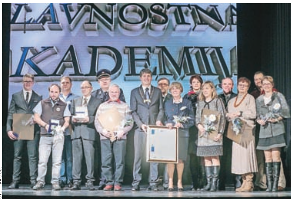
Letošnji nagrajenci z županom Borutom Sajovicem in častno občanko Jožefo Koder.

izposoja drsalk. Drsališče je odprto od ponedeljka do petka od 16. ure do 19.30, ob sobotah od 10. do 12. ure in od 16. ure do 19.30, za odrasle pa tudi od 19.30 do 21. ure. Ob nedeljah in med prazniki lahko drsate od 10. do 12. ure in od 15. do 19. ure. Hokej lahko igrate po dogovoru v večernih urah – od 20. ure do 21.30. Drsališče bo predvidoma odprto do sredine januarja 2018.