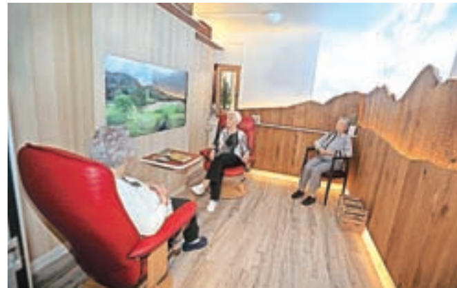
Soba je kot popotovanje z vizualno projekcijo gora v sobi. Stanovalci se v njej odlično počutijo.