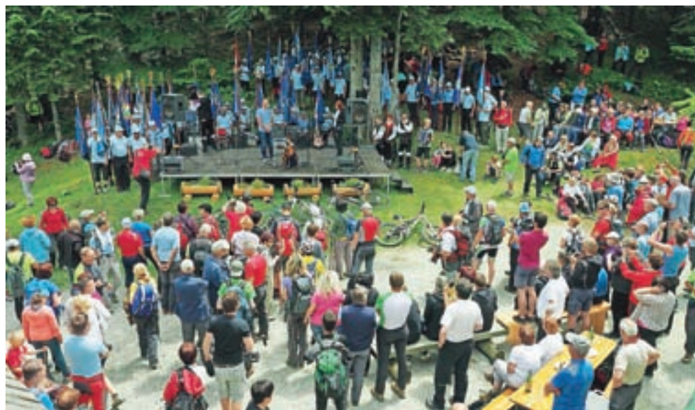
Dan slovenskih planinskih doživetij – Pod Storžič 2017 / FOTO: VILI VOGELNIK

Prav tako smo v Domu pod Storžičem že drugo leto gos-