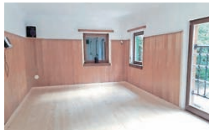
Planinski dom pod Storžičem z urejenim prostorom za učno sobo

kolesarska doživetja. V Planinskem domu pod Storžičem smo uredili kolesarnico s pralnim platojem in učno sobo, v Domu na Kofcah kolesarje čaka nova kolesarnica, v Planinskem domu na Zelenici pa smo uredili prostora za pralnico in dodatna ležišča, ki bodo zaživila že to zimo. V drugem obdobju, ki traja do 30. aprila 2018, bomo prostore opremili do te mere, da bodo kar najbolj ustrezni za kolesarska, pohodniška in zimska doživetja. Po novem nas lahko spremljate tudi na Facebook strani Alpe Adria Karavanke / Karawanken, kjer vas bomo redno informirali o območju ter projektnih aktivnostih in rezultatih.