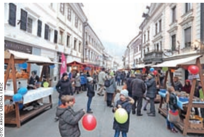
Posnetek je iz lanskega Novoletnega bazarja, na katerega vabijo tudi letos, 19. decembra, od 16. ure dalje.