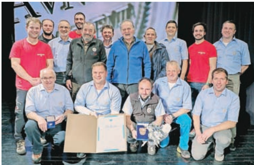
Del članstva Društva Gorska reševalna služba Tržič

prejela Župnijska karitas Križe, ki vse od svoje ustanovitve leta 2000 kontinuirano lajša socialne stiske krajanov v mejah župnije Križe, izjemoma občanov iz drugih delov občine. Najpomembnejše dejavnosti prostovoljcev, trenutno jih je 24, so strnjene okrog medgeneracijskega sodelovanja in vključevanja starejših, bolnih in invalidnih, animiranja otrok in mladine ter razdeljevanja socialne pomoči. Zelo odmeven je tradicionalni dobrotelni koncert na nedeljo Karitas, v zadnjih letih pa se je Župnijska karitas Križe izkazala tudi kot koordinatorica človekoljubnih dogodkov s sodelovanjem večjega števila ponudnikov pomoči.