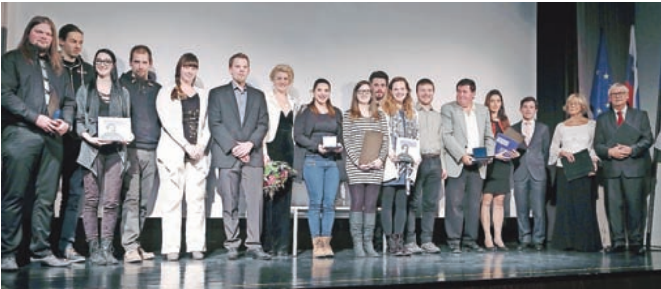
Prejemniki letošnjih Kurnikovih plaket v družbi voditeljev svečane podelitve na odru Kulturnega centra