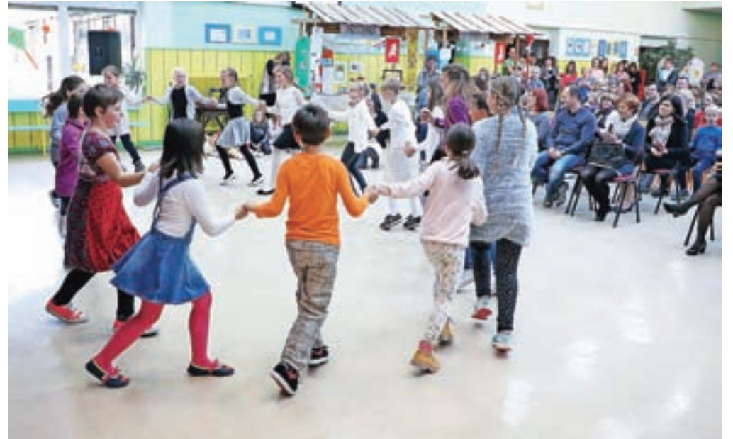
Zaplesali so tudi grški sirtaki.

Križe – Učenci in učitelji iz Osnovne šole Križe živijo slogan Drugačnost bogati. V zadnjih treh letih so bili povezani z devetimi šolami iz Nemčije, Velike Britanije, Nizozemske, Finske, Grčije, Romunije, Poljske, Italije, Španije. Učenci partnerskih držav v projektu Erasmus+ so drug drugemu predstavljali kulturo, jezik, znamenitosti svojih držav. Spoznavali so arhitekturo držav, gradili makete slavnih stavb, proučevali zgodovinske dogodke in junake iz preteklosti. Prebirali so ljudske pripovedke in ustvarjali lutkovne predstave, peli znane pesmi in plesali tradicionalne plesne. Del teh novih spoznanj in znanj so delili na jesenski zaključni prireditvi za starše, prijatelje, tržiškega župana, podžupana in druge predstavnike lokalne skupnosti, ki so jih na panojih pozdravile sončnice drugošolcev, ki so stopili v čevlje nizozemskega slikarja Van Gogha. Otroški pevski zbor je zapel pesem iz priljubljene poljske risanke o medvedku Uhačku, mladinski