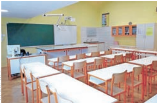
Za učilnico je Občina Trzič namenila 21.535 evrov.